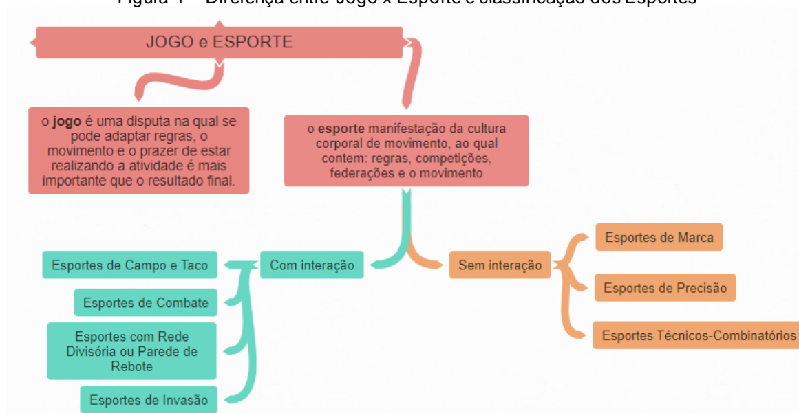
Figura 1 – Diferença entre Jogo x Esporte e classificação dos Esportes